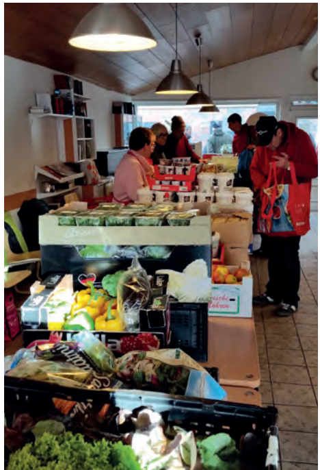
Blick auf das Angebot des Borsteler Tisches

Etwa 30 MitarbeiterInnen sind in den letzten 5 Jahren über 10.000 Stunden lang ehrenamtlich für den Borsteler Tisch tätig gewesen, mit hohem Engagement und Einsatz, mit Spaß und Ernst, immer mit dem Gefühl, eine sinnvolle und wichtige Tätigkeit auszuüben. Klare Regeln und eine ausgefeilte Organisationsstruktur sind Garant für reibungslose Abläufe. Ärgerliche Augenblicke kommen natürlich auch vor, wäre ja