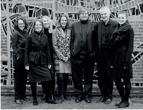
Das A Capelle Ensemble

22. APRIL 2018 | 17:00 | KIRCHE ST. PETER