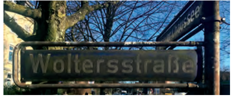
Ihr Strassenschild wartet auf eine pflegende Hand

Es gibt viele Dinge, die Sache des Bezirks oder der Stadt sind: Kaputte Gehwegplatten und