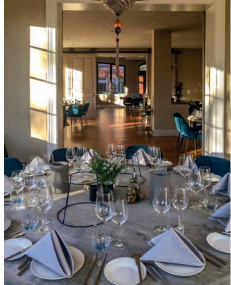
Blick in die Veranstaltungsräume